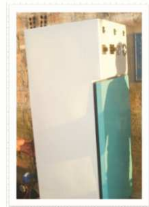
Figura 7. prototipo construido.