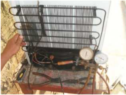
Figura 3. Compresor

El prototipo se construyó con materiales de acero inoxidable, las paredes están completamente aisladas con poroflex, la puerta totalmente hermética y cuenta con una compresora para el sistema de frío (Figura 3) y una bomba de vacío para proporcionar aire al sistema (Figura 4). Para proporcionar temperaturas superiores a 15° C se utilizó focos incandescentes controlados por un termostato (Figura 5). El funcionamiento del equipo es dirigido desde un panel de control (Figura 6). Todas las partes del equipo han sido ensamblados en una unidad cuyo peso es de aproximadamente 50 kg lo que lo convierte en un equipo portátil (Figura 7).