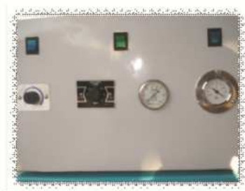
Figura 6. Panel de control.