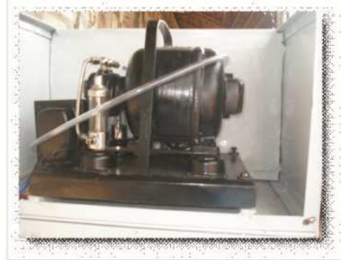
Figura 4. Bomba de vacío