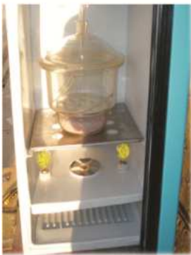
Figura 5. sistema de calefaccion