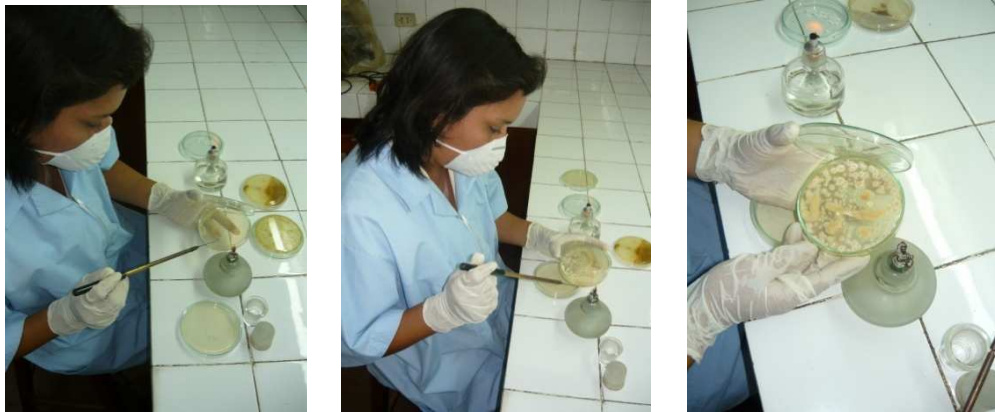
Preparación de los ensayos