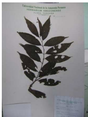
Fig.4. Lugar de colecta de Piper lanceolatum : Carretera Iquitos Nauta km 27

Tabla I.- Características organolépticas y fisicoquímicas de aceite de Piper 1, Piper hispidum Sw. Se utilizaron las hojas