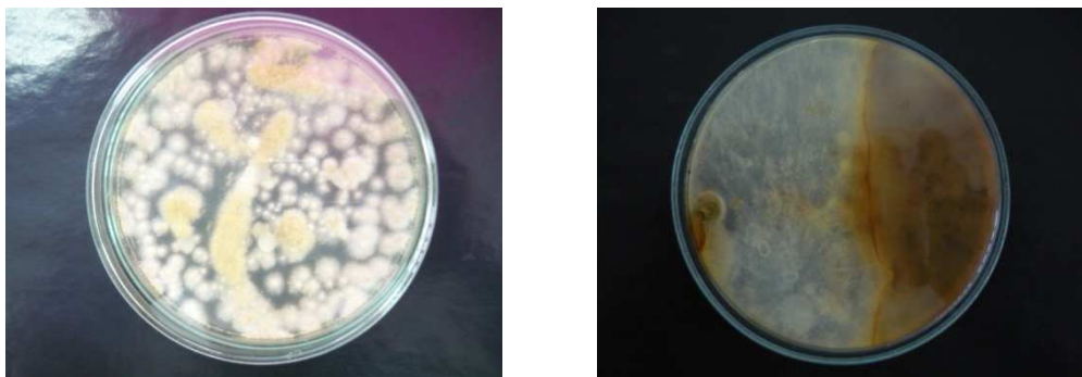
Efecto del aceite esencial