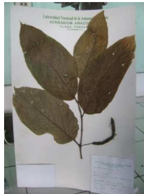
Fig. 3. Lugar de colecta de Piper Asterotricum : Carretera Iquitos Nauta km 27