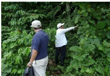
Fig. 1. Lugar de colecta de Piper hispidum sw: km 23,5 Carretera: Iq- Nauta

Las Fig. 1, 2, 3, 4 muestran los lugares de colecta y las muestras de plantas de piperáceas