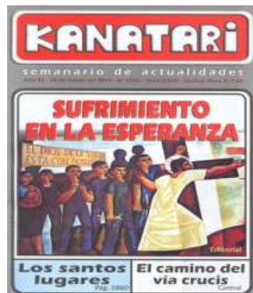
Kanatari. Semanario de actualidades. Iquitos. Año 25, N° 1332, mar., 2010.