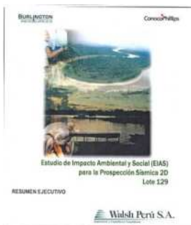
Burlington Resources. Estudio de impacto ambiental y social (EIAS) para la prospección sísmica 2D Lote 129. Resumen Ejecutivo.