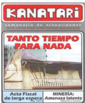
Kanatari. Semanario de actualidades. Iquitos. Año 25, N° 1334, abr., 2010.