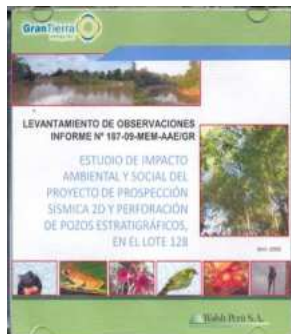
Estudio de impacto ambiental y social del proyecto de prospección sísmica 2D y perforación de pozos estratégicos en el lote 128. Gran Tierra, abr., 2009.