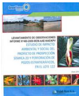
Estudio de impacto ambiental y social del proyecto de prospección sísmica 2D y perforación de pozos estratégicos en el lote 122. Gran Tierra, 2009.