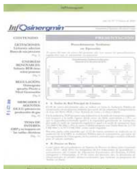
Infosnergmin. Acontecimiento de Regulación y Mercados de Energía. Lima. Año 12, N° 2, febrero. 2010.